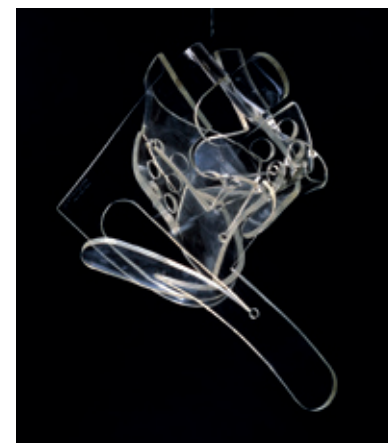
László Moholy-Nagy, Leda and the Swan, 1946. Colección del IVAM.