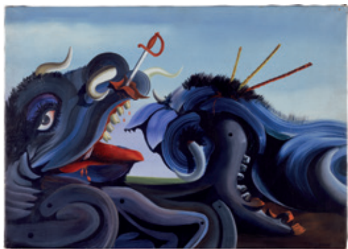
Óscar Domínguez, Le taureau blessé , 1939. Colección del IVAM. © Oscar Domínguez, VEGAP, Alicante, 2022

Constituida fundamentalmente por obras pertenecientes a la colección del IVAM, esta exposición ensaya una lectura en la que más que las diferencias de estilo se contemplan las continuidades, las semejanzas, los ecos mutuos, el esfuerzo compartido, cuando la trama de los acontecimientos históricos es tal que resulta absolutamente determinante en las decisiones poéticas, discursivas, formales o estilísticas; en la mirada y el pensamiento de la humanidad sobre sí misma. Arte en una tierra baldía, 1939—1959 incluye obras de: Albers, Alfaro, Brossa, Buch, Buñuel, Chillida, Dubuffet, Duchamp, Ferrant, Juana Francés, Gil, Julio González, Gorky, Gottlieb, Gumbau, Lucebert, Soulages, Masson, Michaux, Millares, Miró, Newman, Oteiza, Palazuelo, Pascual de Lara, Renau, Matilde Salvador, Saura, Sempere, Tàpies, Reinhardt, Val del Omar... y una mirada fotográfica en torno a la reconstrucción de la vida cotidiana a partir de las imágenes de Catalá-Roca, de Miguel o los Hermanos Mayo.