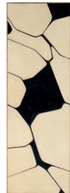
Pablo Palazuelo, Les trois II , 1959. Colección del IVAM

Shaped essentially by works from the collection at IVAM, this exhibition assays a reading in which, more than on the stylistic differences, the focus rests on the continuities, the similarities, the reciprocal echoes, or the shared efforts, and at a time when the plot of the historical developments thickens so much that it has an absolutely decisive impact on any choice, be it poetic, discursive, formal or stylistic; as it also impacts the gaze and the thought upon itself of the entire humanity. Art in a Wasteland, 1939-1959 includes works by Albers, Alfaro, Brossa, Buch, Buñuel, Chillida, Dubuffet, Duchamp, Ferrant, Juana Francés, Gil, Julio González, Gorky, Gottlieb, Gumbau, Lucebert, Soulages, Masson, Michaux, Millares, Miró, Newman, Oteiza, Palazuelo, Pascual de Lara, Renau, Matilde Salvador, Saura, Sempere, Tàpies, Reinhardt, Val del Omar... and a photographic scrutiny of the reconstruction of everyday life, based on images by Catalá-Roca, de Miguel, or the Hermanos Mayo.