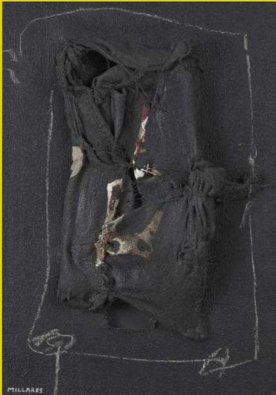
Manuel Millares, "Santa Faz", 1960-65. Colección Arte Siglo XX. MACA, Museo de Arte Contemporáneo de Alicante.

Conocemos la devoción especial que Sempere dispensaba al lienzo verónico, devoción que le llevó a encargar al informalista Manuel Millares una obra con ese tema. La pieza que hoy se guarda en los fondos de la Colección Arte Siglo XX y expuesta en el MACA, Museo de Arte Contemporáneo de Alicante, es una bellísima creación del artista canario donde el referente de la Santa Faz se convierte en una imagen poderosa, un amasijo de arpilleras y cuerdas retorcidas y pintadas de negro salpicadas con el rojo de la sangre del rostro divino; una magnífica representación de la muerte viva plasmada tanto en un trozo de tela como en las imágenes de fe de los creyentes.