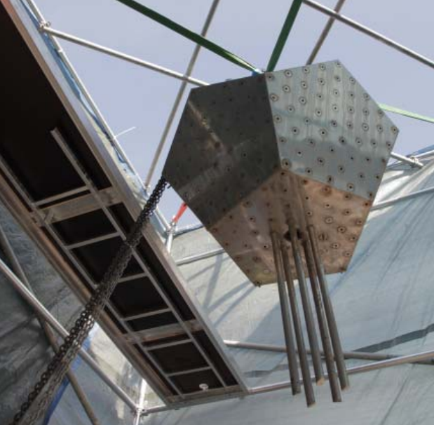
Detall del procés de restauració, 2015.