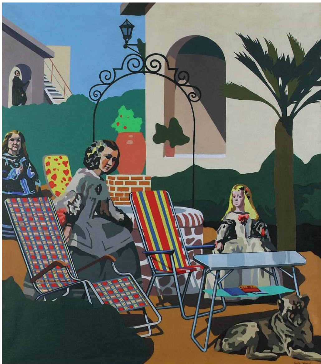
Las Meninas en el Chalet, 1969 • Serie: La recuperación 1967-69. Acrílico sobre lienzo. 100 x 90 cm. Fundación Chirivella Soriano