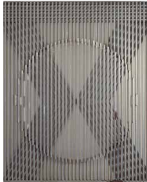
Eusebio Sempere Móvil de acero, 1968 Hierro, 134,7 x 116,8 x 9 cm Museo de Bellas Artes de Valencia

Se han incluido, por su coherencia con lo anterior, algunas obras importantes adquiridas con motivo de la subasta Art i solidaritat celebrada en Valencia en 1983 con motivo de las inundaciones provocadas por la rotura de la presa de Tous. Concretamente obras de Tápies, Manuel Boix, Guinovart y Moisés Villelia.