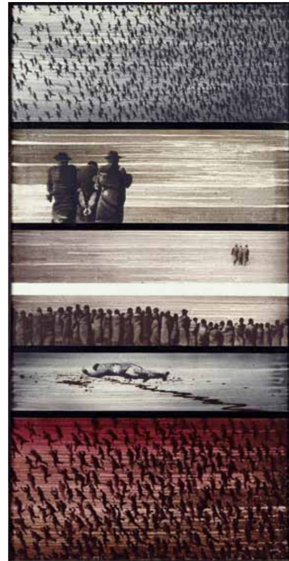
Joan Genovés La calle, 1969 Óleo sobre lienzo, 218 x 100 cm Museo de Bellas Artes de Valencia. Depósito del autor

Sixto Marco, La saleta del tocolog , 1967 Eusebio Sempere, Retrato de mi madre , 1947 Manolo Gil, Adán y Eva (boceto) , 1956 Rafael Armengol, A Sandro Boticelli (Eva) , 1968 ANZO, Aislamiento, 25 , 1968 Andrés Cillero, Bonnie , 1968 Equipo Crónica, El alambique (Serie La Recuperación) , 1967-69 Equipo Realidad, La noche , 1967 Joan Genovés, La calle , 1969. Deposit de l'autor. Joan Genovés, Les voltes , 2002 José Renau, Cartel original de la exposición antológica , 1977 Manuel Hernández Mompó, Detrás del muro hay sol , 1968 Salvador Victoria, Formas en rojo , 1968 José Vento, Icaro sin alas , 1967 Salvador Soria, Gran integración férrea , h. 1967 Aurora Valero, Conjunto nº 2 , 1968 Manuel Boix, Foc , 1982 Moisés Villelia, Maqueta móvil , h. 1975 Josep Guinovart, Coses parades , 1979 Antoni Tápies, Vernis i guix sobre paper marró Eusebio Sempere, Móvil de acero , 1968 Joaquín Michavila, Cuadrantes , 1967 José María López Iturralde, Figura imposible , 1968 Javier Calvo, Punta de flecha , 1972 Jordi Teixidor, Cuatro planos de la simetría del hexaedro , 1968 Ramón de Soto, Estructura simétrica de rotación , 1968 Pedro García Ramos, Composición geométrica con volumen