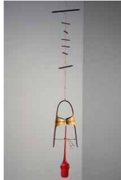
Moisés Villelia Móvil maqueta, 1975 Bambú, 140 x 22 x 22 cm Museo de Bellas Artes de Valencia

Igualmente se ha incluido, en razón del centro donde la exposición va destinada, el excelente “Retrato de mi madre” de Eusebio Sempere.