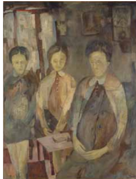
Sixto Marco La saleta del tocóleg , 1967 Óleo sobre lienzo, 133,7 x 99,7 cm Museo de Bellas Artes de Valencia